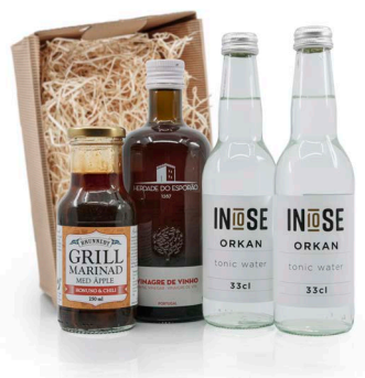
PRESENTSET BBQ EVENINGS

INNEHÅLLER: GRILLMARINAD, 2 X TONIC WATER, RÖDVINSVINÄGER 500ML. PACKAS MED TRÄULL I WELLÅDA. MÅTT PÅ BOX: 32X22X8,5 CM