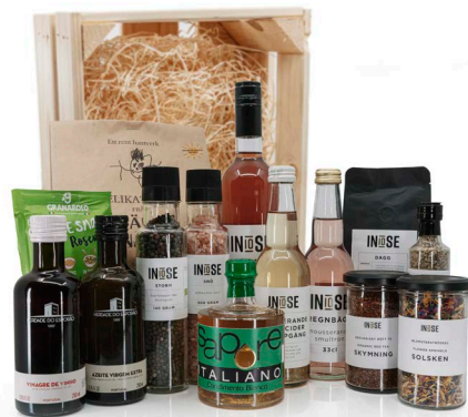
PRESENTSET SUMMER PICNIC

INNEHÅLLER: SALTKVARN, PEPPARKVARN, AZIETE OLJA 250ML, VIT VINÄGER GREEN LABEL, BLMSTERSTRÖSSEL, ÄPPLCIDER, CHEESE SNACKS, MALET KAFFE DAGG 250ML, RÖTT TE INIÖSE, GRÄNNA KNÄCKE, ÖRTSALT, SMULTRONDYCK, RABARBERSAFT, RÖDVINSVINÄGER 500ML. PACKAS I EN LÅDA AV TRÄ MED TRÄULL I BOTTEN. MÅTT PÅ LÅDAN: 44X37X21 CM