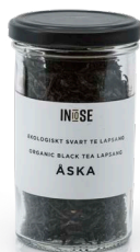
EKOLOGISKT SVART TE LAPSANG ÅSKA

Vi har valt att jobba med ekologiskt te med spännande smaker. Vi har som grund valt ut tre olika sorter. Ett svart, ett rött och ett grönt. Alla spännande på sitt sätt.