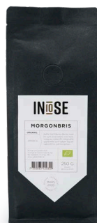
MALET BRYGGKAFFE ARABICA BRYGGKAFFE MORGONBRIS

KAFFE FRÅN MEXIKO BERILO MED FIN SYRA, BRA BALANS OCH MED INSLAG AV NÖTTER. EN RIKTIG KAFFEUPPLEVELSE SOM HJÄLPER DIG ATT VAKNA TILL LIV PÅ MORGONEN.