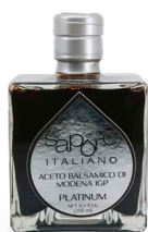
ACETO BALSAMICO IGP PLATINUM

EXKLUSIV BALSAMVINÄGER SOM LAGRATS I ÖVER 10 ÅR PÅ EK FAT. GOD TILL OST, EFTERRÄTTER OCH FRUKT