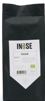
MALET BRYGGKAFFE ARABICA BRYGGKAFFE DAGG

LIKA TYDLIGT SOM DU SER DAGGEN I GRÄSET SÅ ÄR DENNA GUATEMALA FINCA BOURBON TYDLIG I SIN SMAK AV CHOKLAD OCH NÖT MEN ÄR MILD I SMAKEN MED RUND KROPP.