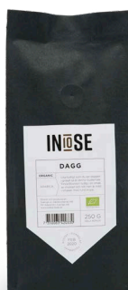
HELA BÖNOR ARABICA BÖNOR DAGG

LIKA TYDLIGT SOM DU SER DAGGEN I GRÄSET SÅ ÄR DENNA GUATEMALA FINCA BOURBON TYDLIG I SIN SMAK AV CHOKLAD OCH NÖT MEN ÄR MILD I SMAKEN MED RUND KROPP.