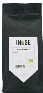
MALET BRYGGKAFFE ARABICA BRYGGKAFFE RIMFROST

MED INSLAG FRÅN BRASILIEN, PERU OCH HONDURAS FÅR DU HÄR ETT KRAFTIGT KAFFE SOM GER DIG EN SNÄLL RUND KROPP MED SMAK AV CHOKLAD OCH NÖTTER.