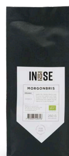
HELA BÖNOR ARABICA BÖNOR MORGONBRIS

KAFFE FRÅN MEXIKO BERILO MED FIN SYRA, BRA BALANS OCH MED INSLAG AV NÖTTER. EN RIKTIG KAFFEUPPLEVELSE SOM HJÄLPER DIG ATT VAKNA TILL LIV PÅ MORGONEN.