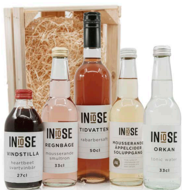
PRESENTSET TASTE OF NATURE

INNEHÅLLER: HEARTBEAT SVARTVINBÄR JUICE, RABARBERSAFT, SMULTRONDYCK, TONIC WATER, ÄPPLCIDER. PACKAS I EN LÅDA AV TRÄ MED TRÄULL I BOTTEN. MÅTT PÅ LÅDA: 35X25X13 CM