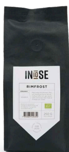
HELA BÖNOR ARABICA BÖNOR RIMFROST

MED INSLAG FRÅN BRASILIEN, PERU OCH HONDURAS FÅR DU HÄR ETT KRAFTIGT KAFFE SOM GER DIG EN SNÄLL RUND KROPP MED SMAK AV CHOKLAD OCH NÖTTER.