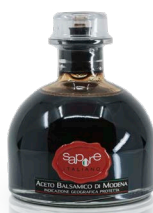
ACETO BALSAMICO IGP CALAMAIO

LAGRAD PÅ EK FAT. EN TJOCK VINÄGER MED MYCKET STRUKTUR OCH BRA SYREHALT. UNDERBAR TILL JORDGUBBAR.