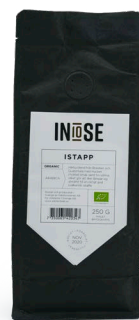
MALET BRYGGKAFFE ARABICA BRYGGKAFFE ISTAPP

HÄRLIG BLEND FRÅN BRASILIEN OCH GUATEMALA MED MYCKET CHOKLAD SMAK SAMT FIN SÖTMA, VILKET GÖR ATT DEN LÄMPAR SIG UTMÄRKT TILL EN RIKTIGT GOD SVALKANDE ISKAFFE.