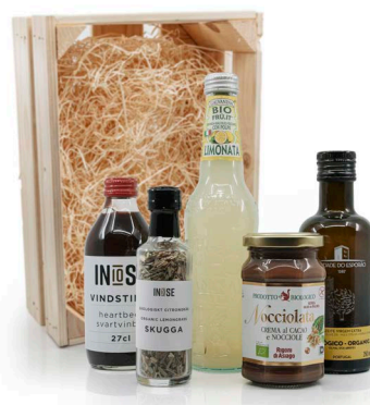
PRESENTSET HEALTHY AS HELL

INNEHÅLLER: HEARTBEAT SVARTVINBÄR JUICE, NÖTCREME EKO, LIMONATA EKO, CITRONGRÄS EKO, BIO OLIVOLJA 250ML. PACKAS I EN LÅDA AV TRÄ MED TRÄULL I BOTTEN. MÅTT PÅ LÅDA: 35X25X13 CM